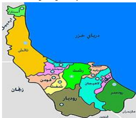
ت (۱): محدوده استان گیلان