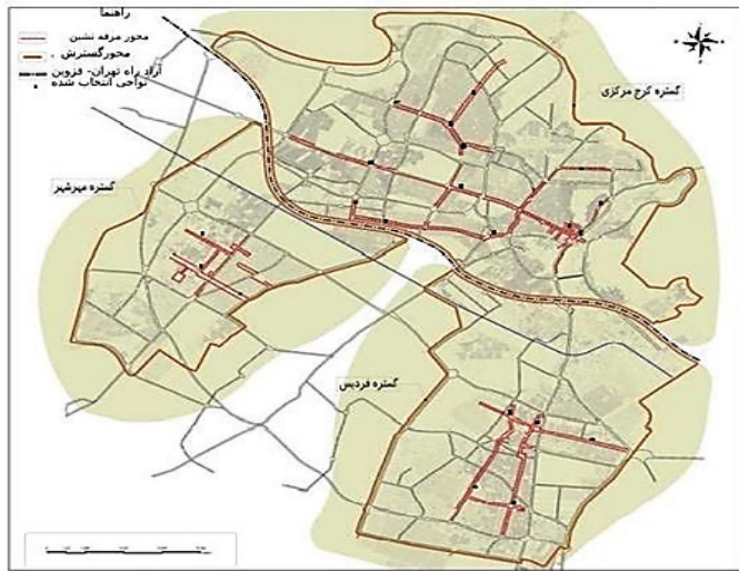
شکل شماره (۴): پهنه‌های مرفه‌نشین شهر کرج

قرار گرفته است. ارتفاع متوسط این شهر از سطح دریا ۱۳۲۱ متر است. بر اساس نتایج سرشماری عمومی نفوس و مسکن سال ۱۳۹۵، جمعیت آن ۱/۷۰۹/۴۸۱ نفر است (مرکز آمار ایران، ۱۳۹۵).