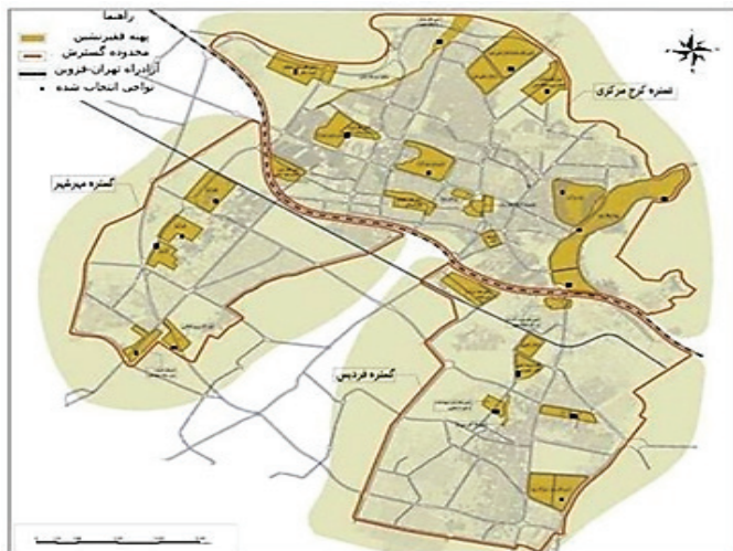
شکل شماره (۳): پهنه‌های فقیرنشین شهر کرج