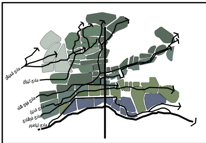
نقشه شماره ۲: عبور شبکه مادی ها از میان محلات در شمال شهر

که به آب داشتند پیرامون مادی ها شکل می گرفتند. به طور مثال چهارباغ صدر از یک طرف منتهی به مادی نیاصرم و از طرف دیگر به رودخانه منتهی می شد (اصفهانی ۱۳۳۸). مکانیابی عناصر شهری نیز در طرح توسعه شهر نیز مستلزم حضور آب بود و جانمایی دولتخانه صفوی از این امر مستثنی نبود به همین منظور این میدان در مکان باغ تاریخی نقش جهان که دو مادی فرشادی و فدین و شاخه ای از جوی شاه از شمال و جنوب آن عبور می کرد ساخته شد به طوریکه نامداریان و دیگران (۱۳۹۵) یکی از مؤلفه های تأثیر گذار در اندازه میدان را فاصله میان دو مادی عنوان کرده است.