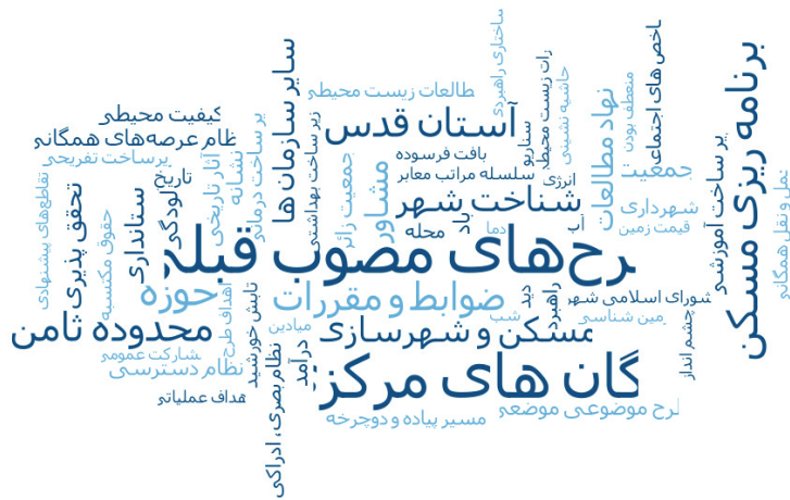
شکل شماره ۳: ابر واژگان کدها

بیانگر تأکید فرایند تصویب بر گزارش‌های نهایی (و نه فرایند دستیابی به آن) است. ملاحظات کیفی در اسناد برنامه‌ریزی شامل کدهای ضوابط و مقررات، بافت‌های ویژه، نظام بصری ادراکی، نظام عرصه‌های همگانی، نظام دسترسی و شناخت شهر است. در این میان ضوابط و مقررات با ۶۷ فراوانی دارای بیشترین تأکیدها بوده است. بیشترین وابستگی بین ملاحظات کیفی در اسناد برنامه و سازمان برنامه‌ریزی در تحلیل محتوای متن مصوبات طرح جامع سوم شهر مشهد بر اساس جدول شماره ۵ مشاهده می‌شود. نکته واجد اهمیت مرتبط با تحلیل محتوای مصوبات طرح جامع شهر مشهد، تفاوت در موضوعات مهم هریک از مراجع تصویب است. در مجموع کارگروه امور زیربنایی با پنج مصوبه و ۳۳۸ کد دارای بیشترین سهم و شورای برنامه‌ریزی استان با دو مصوبه و ۳۶ کد دارای کمترین سهم در کدهای استخراج شده بودند. در کمیسیون تخصصی کارگروه امور زیربنایی ملاحظات کیفی در اسناد برنامه دارای بیشترین اهمیت و زیرساخت‌های بهداشتی-درمانی از نگاه این مرجع