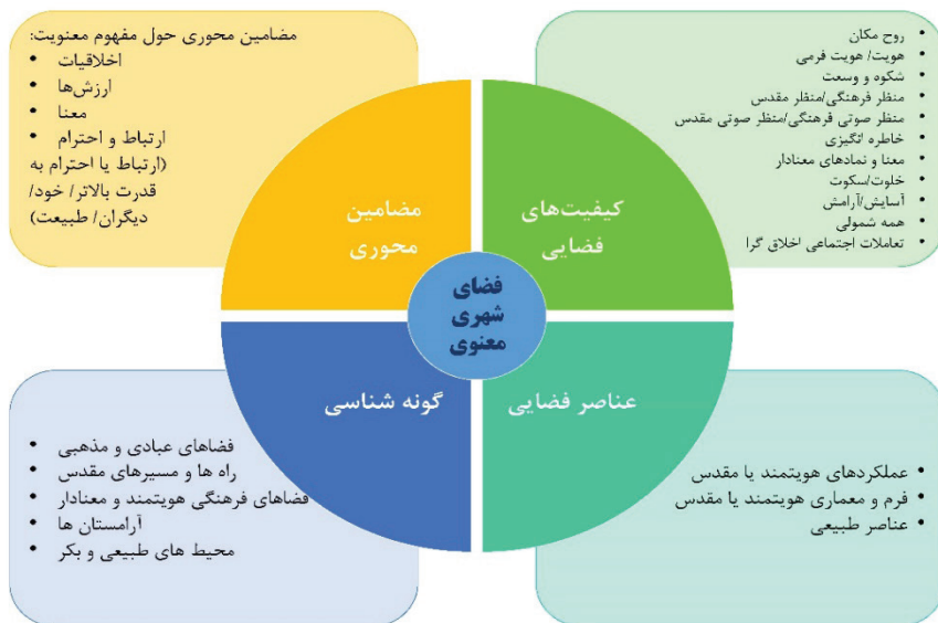
شکل شماره (۱): چارچوب نظری فضای شهری معنوی