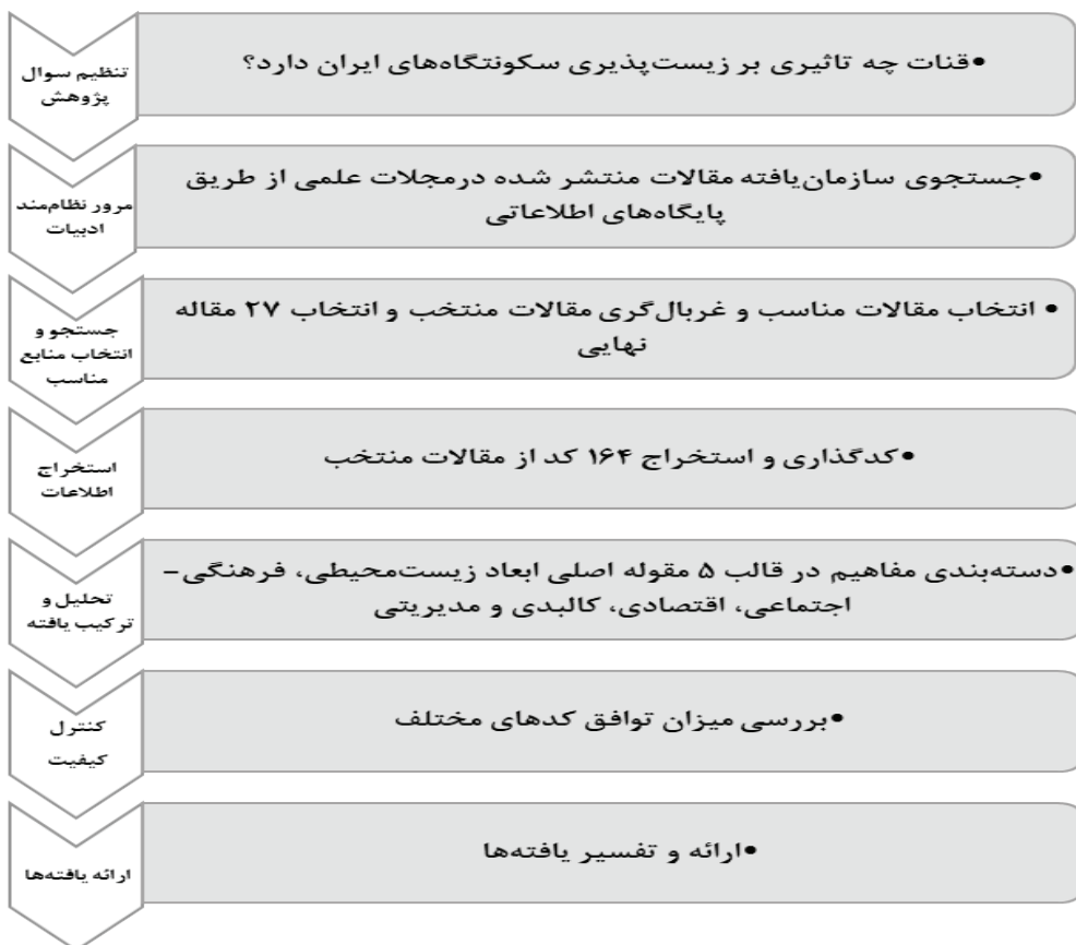
شکل شماره (۱): روش پژوهش حاضر با استفاده از روش هفت‌مرحله‌ای باروسو و ساندوسکی (۲۰۰۷) (Sandelowski & Barroso, 2007)