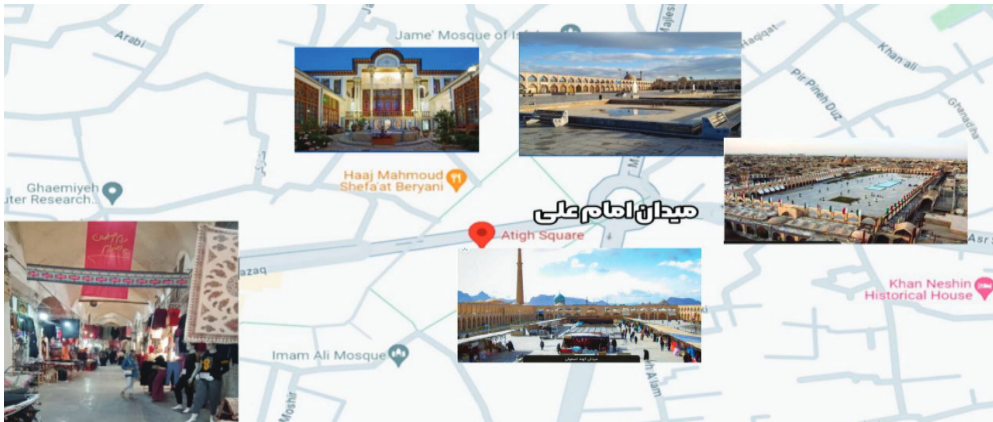
نقشه شماره (۲): محدوده مورد مطالعه در اصفهان (محله سبزه میدان)