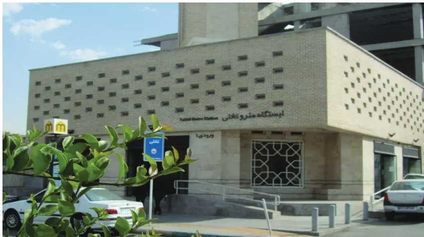
تصویر شماره (۱): ایستگاه متروی تختی