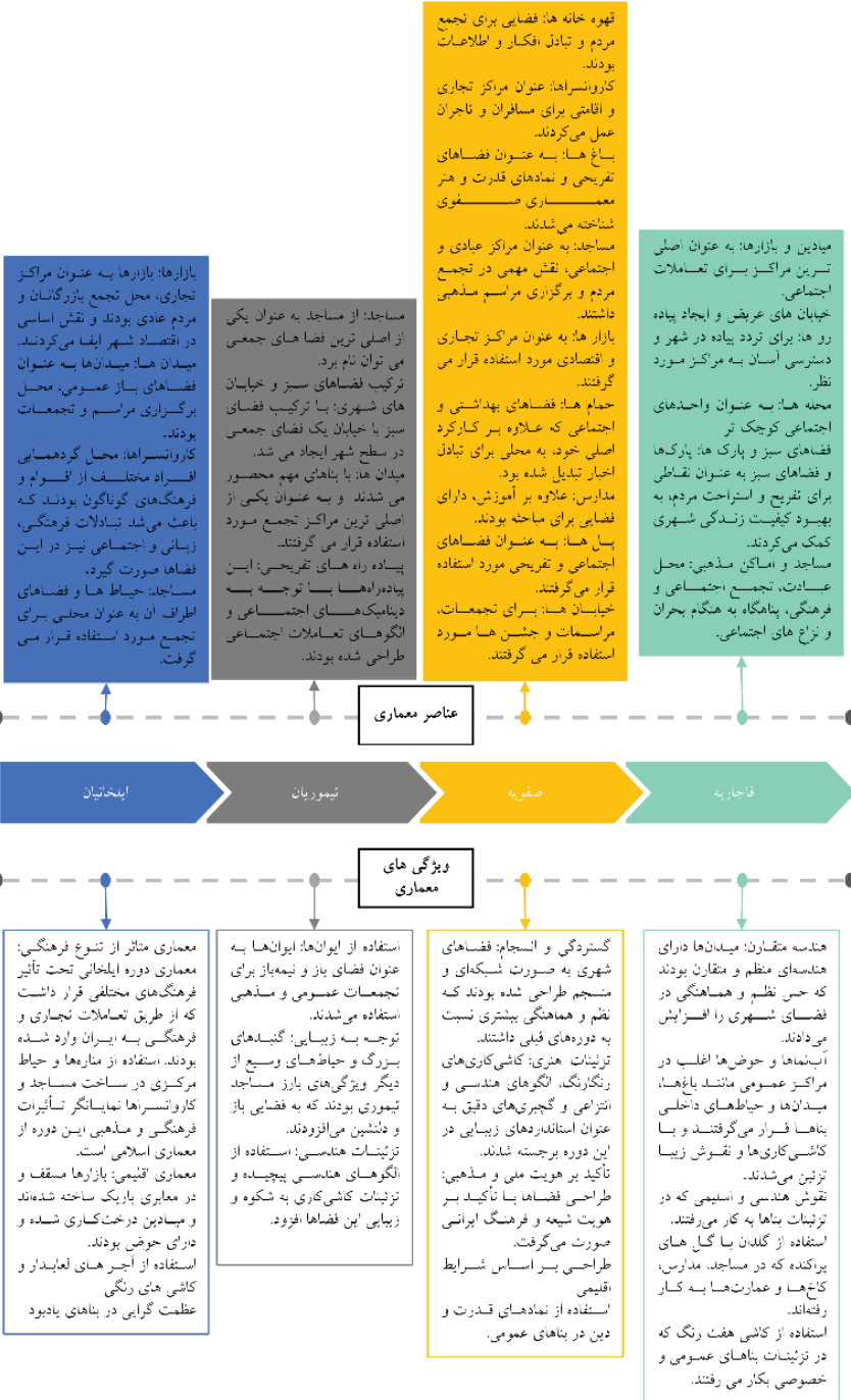
نمودار ۱: نمودار زمان برای دوره های تاریخی بررسی شده